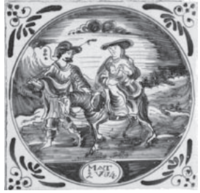
Hl. Familie auf der Flucht, Mt 2,14

Oranienbaum gilt als ein kleines Stück Holland. Und so lassen sich im gefliesten Sommerspeisesaal des Schlosses auch Bibelfliesen finden.