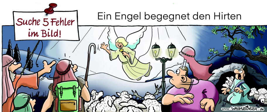
Angel, Schulranzen, Mikrofon, Geweih, Laterne