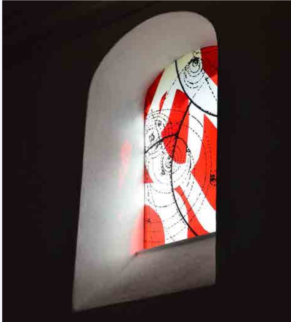
„Lichtungen“ Moderne Glaskunst in historischen Kirchen: Dorfkirche Garitz / Tony Cragg