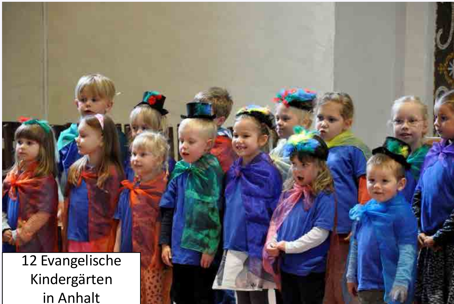
12 Evangelische Kindergärten in Anhalt