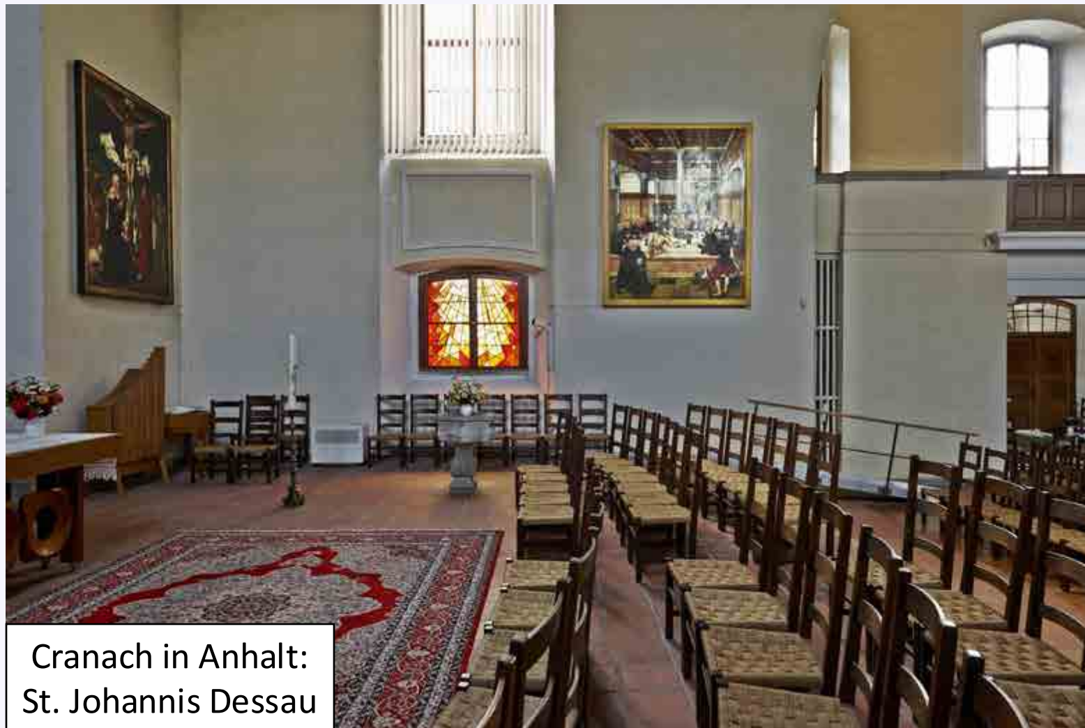
Cranach in Anhalt: St. Johannis Dessau