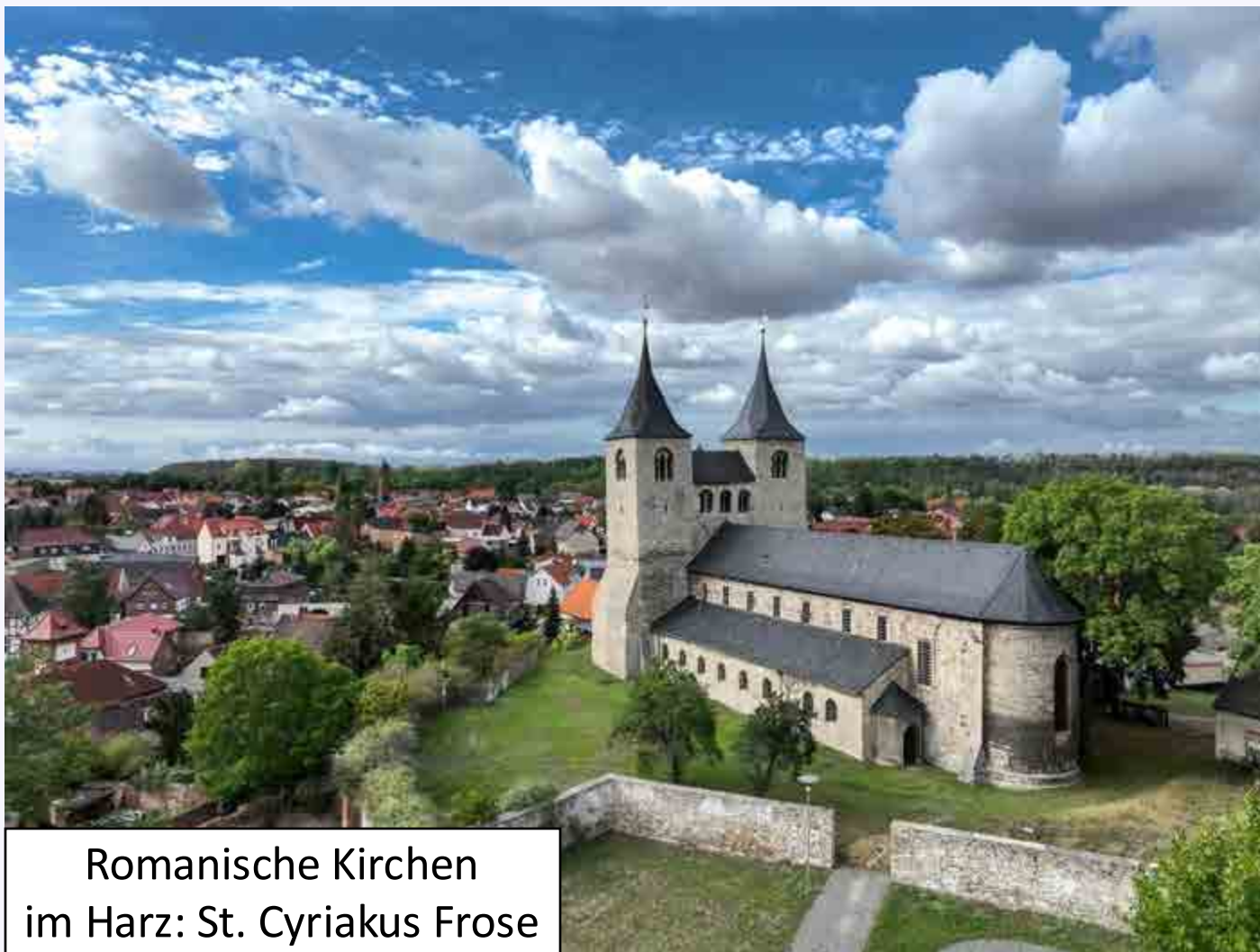
Romanische Kirchen im Harz: St. Cyriakus Frose