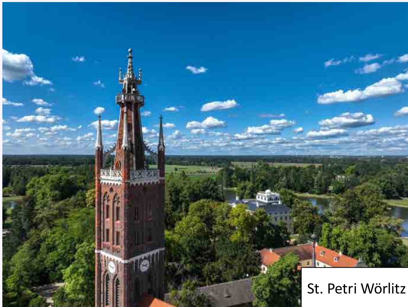
St. Petri Wörlitz