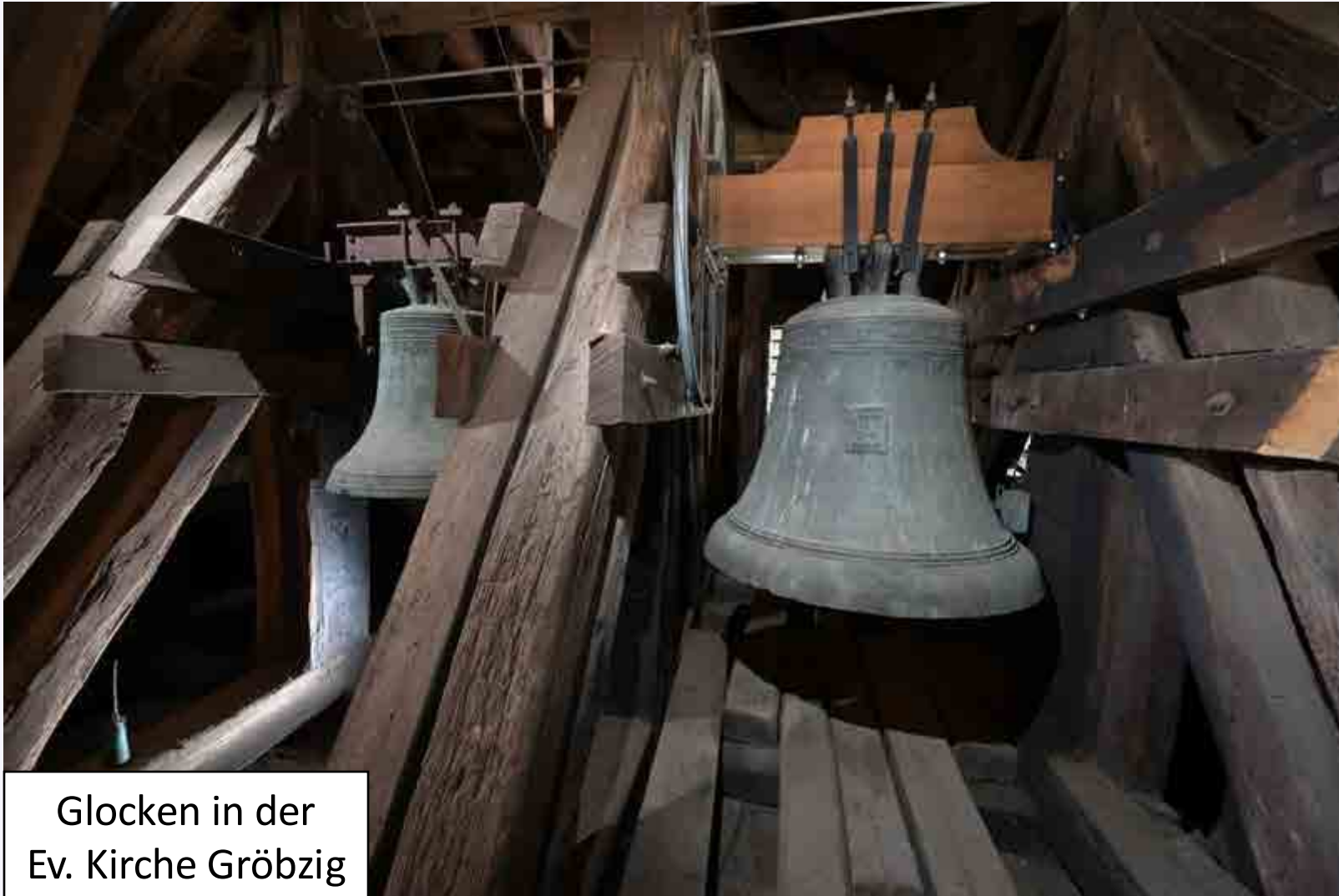
Glocken in der Ev. Kirche Gröbzig