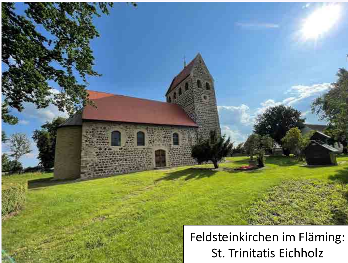
Feldsteinkirchen im Fläming: St. Trinitatis Eichholz