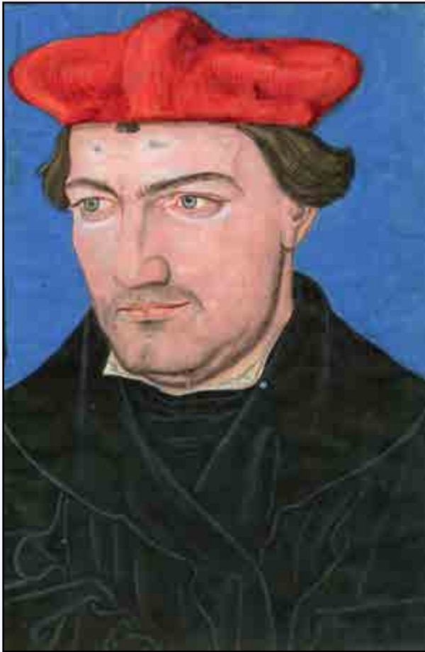
Fürst Georg III. von Anhalt (1507 – 1553) Reformator Anhalts