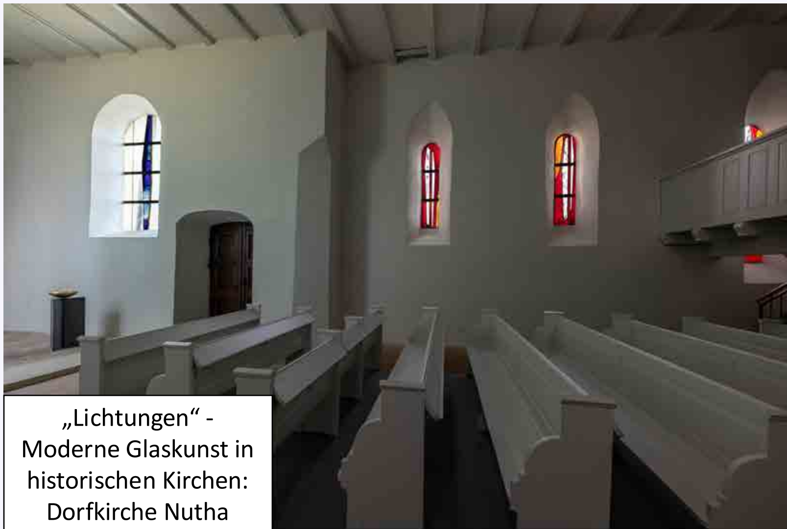
„Lichtungen“ - Moderne Glaskunst in historischen Kirchen: Dorfkirche Nutha