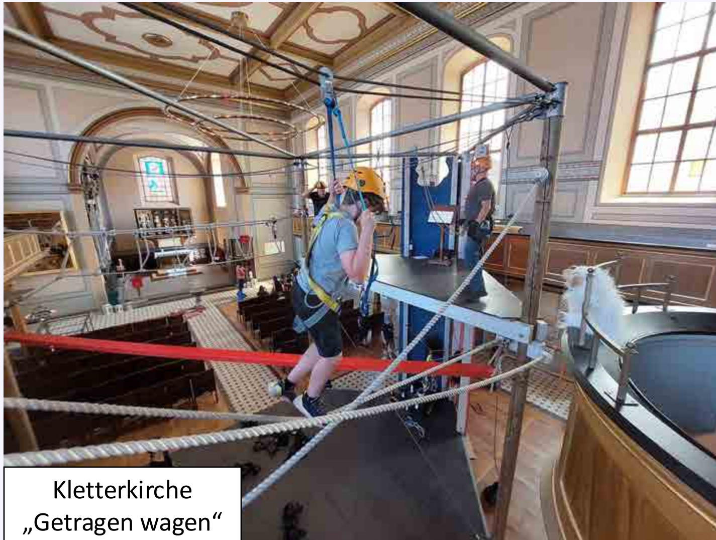
Kletterkirche „Getragen wagen“