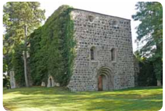
Der meterhohe Efeu an der Nordwand der Kirche in Ankuhn wurde entfernt.

Die jetzt erfolgte Beseitigung des meterhohen Efeus an der Nordfassade der Marienkirche in Ankuhn bildet den Auftakt für eine mit Gesamtkosten von rund 50 000 Euro veranschlagte Maßnahme zum Erhalt des 1945 stark zerstörten Gotteshauses. Das Geld fließt in die Stabilisierung der brüchigen Mauerkrone des offenen Kirchenschiffes. Mit einer Blechabdeckung soll zukünftig verhindert werden, dass Regenwasser in das mittelalterliche Gemäuer dringt. Gleichzeitig erfolgt die Sanierung der Fassade. Fehlende Steine werden ersetzt und alles neu ausgefugt. Bei der Finanzierung des Projektes kann die Gemeinde erstmals auf Fördermittel setzen. So unterstützt die Deutsche Stiftung Denkmalschutz das Vorhaben mit 11 000 Euro. Zu den Geldgebern gehören ebenfalls die Landeskirche, der Landkreis Anhalt-Bitterfeld und Lotto Toto. Darüber hinaus tragen Spenden und Eigenmittel dazu bei, dass die Sicherung der Mauerkrone realisiert werden kann.