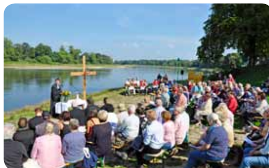
Gottesdienst an der Elbe bei Dessau