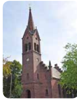
Vor der Kirche in Elsnig stand die nun zerstörte Lutherfigur.

aufgestellt. Immerhin liegt die Elsnigker Kirche am Lutherweg und wir wollten mit der Figur darauf aufmerksam machen.“ Nun sei man sehr enttäuscht, dass die aus Sperrholz gefertigte Figur mit roher Gewalt zerstört wurde. „Eine Reparatur ist möglich, aber der Aufwand genauso groß, als würde man sie neu anfertigen.“ Geschaffen wurde die Luther-Figur vom Köthener Kunstmaler Steffen Rogge. Der reine Materialwert, der von der Polizei als Verlust angegeben wurde, beläuft sich auf nicht einmal 50 Euro. Insofern ist Rogge auch unschlüssig, ob man die Figur reparieren sollte oder nicht.