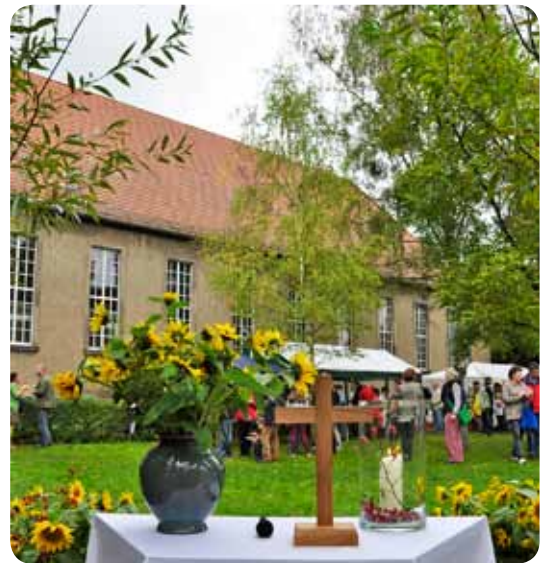
Anhaltischer Obsttag an der Auferstehungskirche