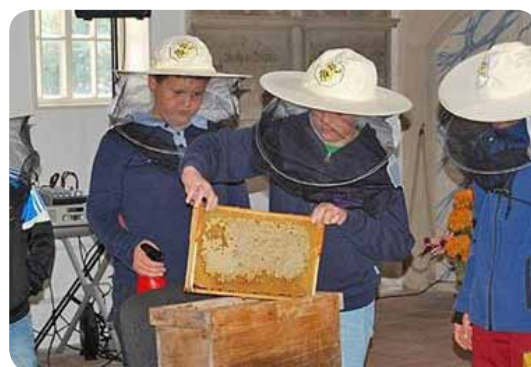
Die Bienenkinder-AG aus Bernburg lag vorn beim Umweltpreis der Landeskirche.