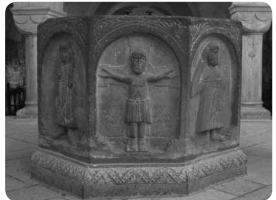
Vor 150 Jahren wurde der Taufstein in Gernrode aufgestellt.

Nach 150 Jahren wurde am 30. August in der Kirche St. Cyriakus in Gernrode ein Festgottesdienst zur Aufstellung des Taufsteins am 30. August 1865 mit einer Taufe gefeiert. Dabei wurde daran erinnert, dass es Herzog Leopold Friedrich von Anhalt-Dessau (1817-1871) war, der diesen Stein aus der niedergelegten Kirche zu Alleben/Saale schenkte. Der preußische Restaurator Ferdinand von Quast (1807-1877) war zu dieser Zeit im Auftrag Herzog Alexander Carl von Anhalt-Bernburg (1834-1863) mit der Sanierung der Kirche beschäftigt. Er ließ den 93 cm hohen und mit 120 cm Durchmesser recht großen Sandstein in der ehemaligen ottonischen Erdgeschosshalle im Westen der Kirche aufstellen. Anhand der Reliefdarstellungen aus dem Leben Jesu in den acht Rundbogennischen der Außenseite kann der Historiker erkennen, dass dieses Kunstwerk aus der Zeit um 1150 stammt. Im Taufregister ist die erste Taufe