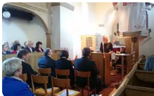
Jubiläumsfeier der Stiftung „Entschlossene Kirchen“ zu deren zehnjährigem Bestehen