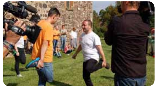
Ganzer Einsatz der Gemeinde Eichholz

Die Eichholzer stehen wie eine Eiche, hieß es nach der ersten Runde beim MDR-Spezial um himmlische 200 000 Euro. Erst wurde das Team St. Bartholomäi besiegt und Eichholz gewann 75 000 Euro. Sie waren in Strohhallenschieben und Auf-einem-Bein-Stehen einfach nicht zu schlagen. Beim zweiten Ausscheid zimmerten die Eichholzer eine Kirche aus Holz zusammen und gewannen 125 000 Euro. Schließlich ging es nach Zwickau in die MDR-Show. Erst da mussten sich die Eichholzer geschlagen geben. Gefeiert wird trotzdem, und zwar am 31. Oktober um 19 Uhr in Eichholz. Die Sendung am 27. Oktober um 19.50 Uhr zeigt den Wettkampf gegen Zerbst, am 29. Oktober das Halbfinale aus Wittenberg und schließlich am 31. Oktober das Finale aus Zwickau. Organisiert wurde der TV-Wettbewerb „Mach dich ran!“ vom Mitteldeutschen Rundfunk und der Stiftung zur Bewahrung kirchlicher Baudenkmäler (Stiftung KiBa).