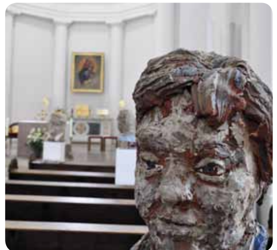
20 Tonksulpturen sind in der Schlosskirche zu sehen.