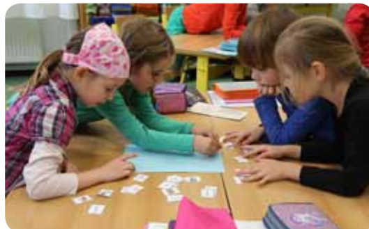
Kinder der Ev. Grundschule Zerbst