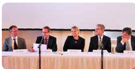
Podiumsdiskussion zur Tagung „Anhalt[er]kenntnisse“ im Fasch-Saal der Stadthalle Zerbst

Informationen im Internet unter www.elbekirchentag.de .