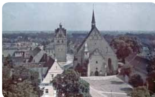
Die Zerbster Kirche St. Bartholomäi in einer historischen Farbaufnahme