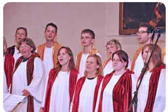
Gospelchor „Heaven Sings“