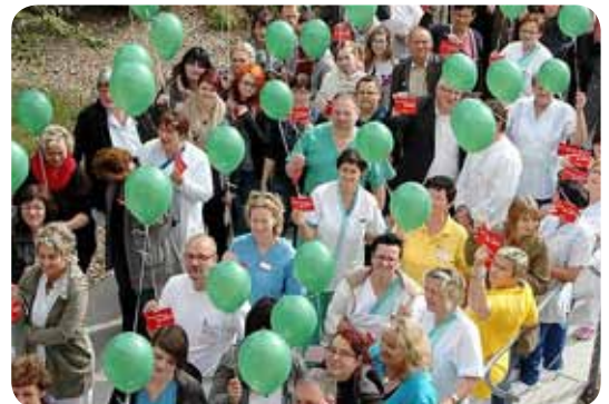
Der Protest der Krankenhausmitarbeiter

Am 23. September fand in Berlin eine zentrale Kundgebung gegen das geplante Krankenhausstrukturgesetz statt, das kleine Krankenhäuser gefährdet. Mit einer „Aktiven Mittagspause“ vor Ort in Dessau flankierten 90 Mitarbeitende des Diakonissenkrankenhauses Dessau (DKD) und der Landeskirche Anhalts die zentrale Kundgebung in Berlin. Der unter dem Motto „Krankenhaus-Reform - So nicht!“ stehende Protest am Brandenburger Tor wurde im Rahmen des Krankenhausaktionstages bundesweit von hunderten Krankenhäusern unterstützt. 15 Mitarbeitende des DKD waren nach Berlin gefahren. Bereits im Oktober soll das umstrittene Gesetz im Bundestag beschlossen werden. Die Aktionen waren daher getragen von der Möglichkeit der Einflussnahme in letzter Minute.