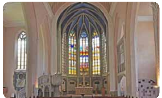
Die Marienkirche gehört zum Stationenweg.

Von Turku im Norden bis Rom im Süden, Dublin im Westen bis Riga im Osten: 68 Orte in 19 verschiedenen Ländern und 47 unterschiedlichen Kirchen prägen den Europäischen Stationenweg auf dem Weg zum Reformationsjubiläum Wittenberg. Die letzte Station vor Wittenberg liegt in Anhalt und heißt Bernburg. Der Stationenweg „Tore der Freiheit“ wird dort am 18. Mai 2017 Halt machen. In der Bernburger Marienkirche wurde erstmals in der Stadt das evangelische Abendmahl ausgeteilt.